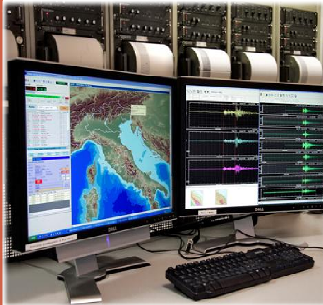
Dai rulli al digitale (la sala sismica dell'INGV)

Oggi, infatti, le conoscenze scientifiche e la tecnologia sono presenti in ogni ambito e in ogni momento della nostra vita e sono alla base delle scelte che riguardano, direttamente o no, l'ambiente in cui viviamo.